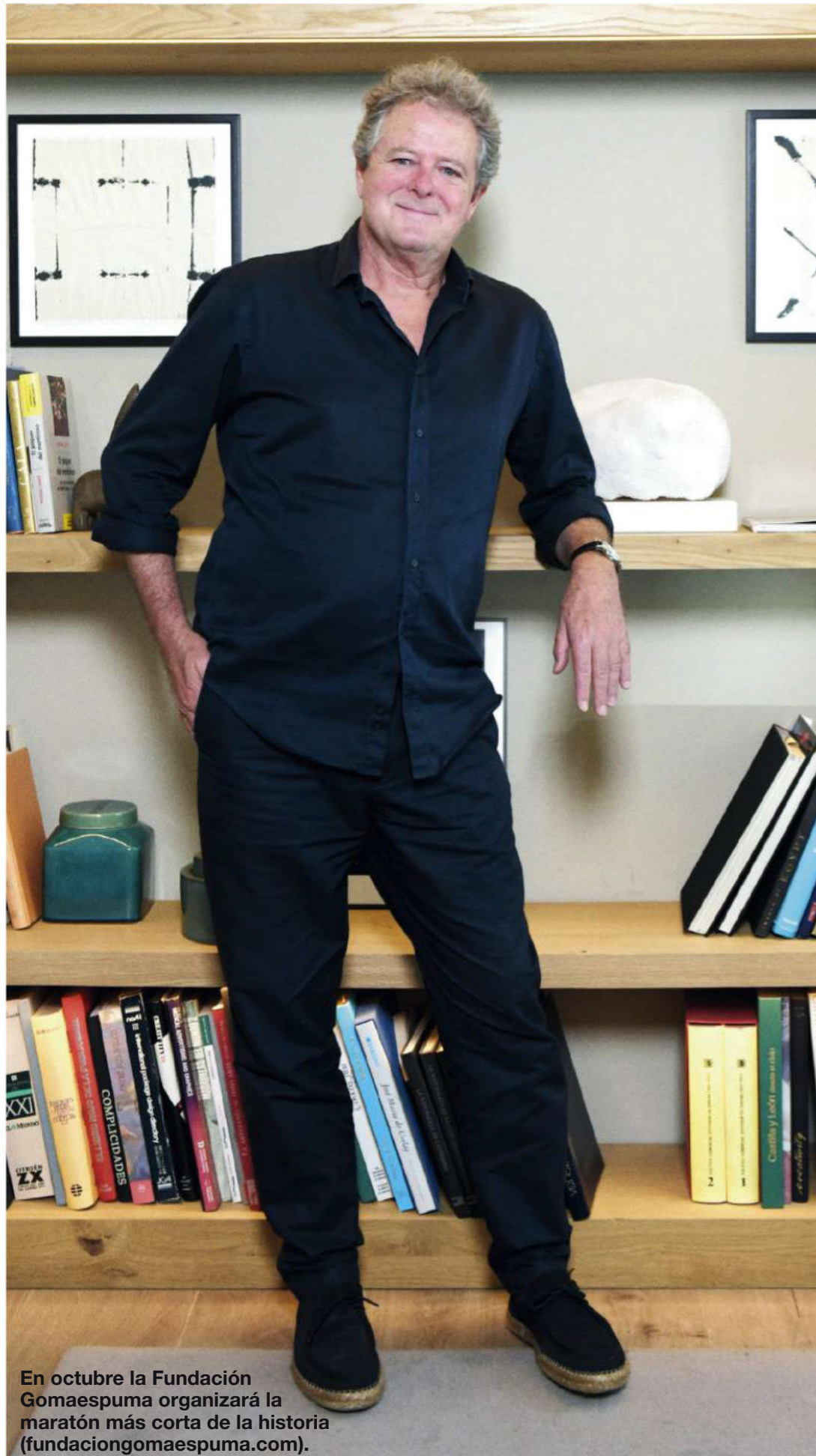
En octubre la Fundación Gomaespuma organizará la maratón más corta de la historia (fundaciongomaespuma.com).